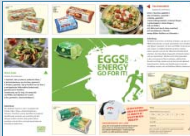
Fit mit Ei: Der Flyer zeigt wie's geht. Mit vielen Rezepten rund ums Ei.

waren auch wieder HARTMANN-Läufer am Start. Durch die sportliche Unterstützung von Partnern und Kunden konnten 3 gemischte Staffel-Teams auf die Strecke gehen.