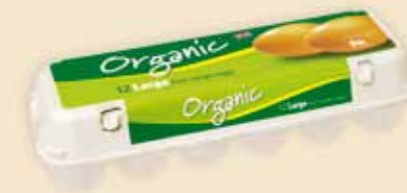
Mini Poster Pack™ 12 œufs – E5412