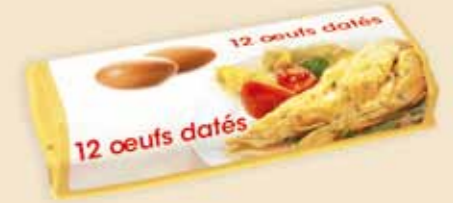
Superface® 12 œufs – E7312