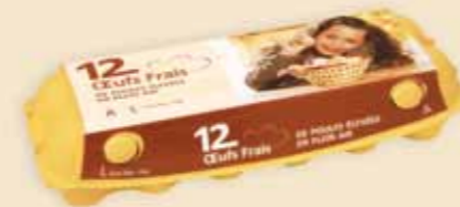
imagic® 12 œufs – E9212