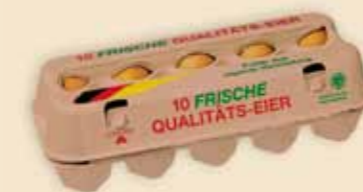
Fresh Pack™ 10 œufs – E3810