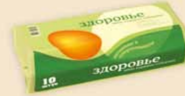
Superface® 10 œufs – E7210