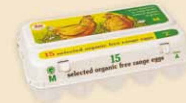
Plus Pack™ 15 œufs – E5915