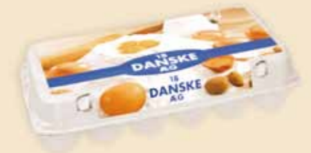
Mini Poster Pack™ 18 œufs – E3918