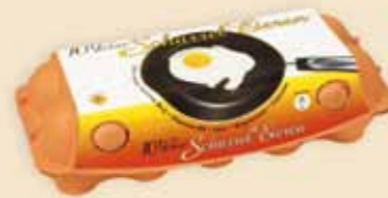
imagic® 10 œufs – E9910