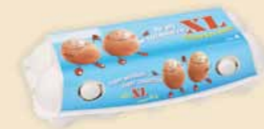
imagic® MAX 10 œufs – E9410