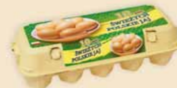
Mini Poster Pack™ 10 œufs – E3310