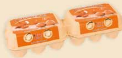
Mini Poster Pack™ 6 œufs – E5312