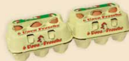
Fresh Pack™ 6 œufs – E4912

Une impression avec des couleurs vives permet d'exprimer clairement votre message. Avec son couvercle ajouré, cet emballage disponible en 2 formats est habituellement synonyme de fraîcheur et d'offre économique.