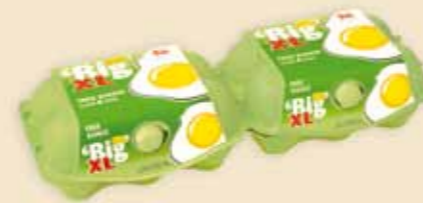
imagic® MAX 6 œufs – E9312