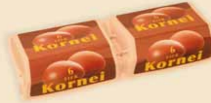
Superface® 6 œufs – E7412