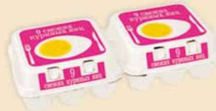
Plus Pack™ 9 œufs – E7918