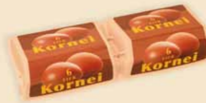
6er Superface® – E 7412