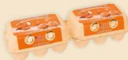
6er Mini Poster Pack™ – E 5312