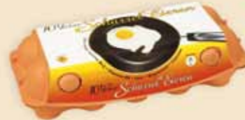
10er imagic® – E 9910