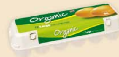
12er Mini Poster Pack™ – E 5412