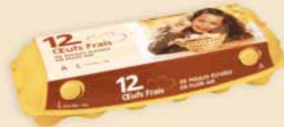
12er imagic® – E 9212