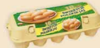
10er Mini Poster Pack™ – E 3310