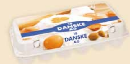
18er Mini Poster Pack™ – E 3918