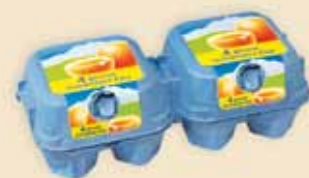
4er Mini Poster Pack™ – E 6608

Direktbedruckt als Plus Pack™ oder mit hochwertigem Etikett als Mini Poster Pack™ wird diese Verpackung in 7 verschiedenen Größen allen gängigen Einheiten gerecht. Zahlreiche Gestaltungsmöglichkeiten schaffen attraktive Sortimente im unteren und mittleren Marktsegment.