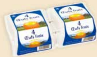
4er Superface® – E 7108

In 4 Größen und 8 Farben liefern wir erstklassige Qualität mit hochwertigem Etikett. Das Premiumprodukt mit der großen Kommunikationsfläche eignet sich für starke Marken ebenso wie für Eierspezialitäten. Auffallend ist die erfolgreiche Werbewirkung am POS.