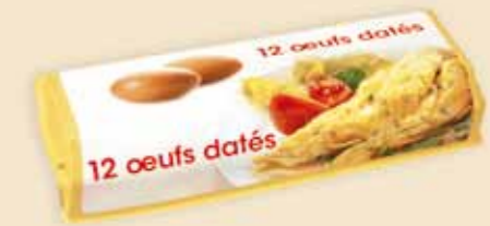
12er Superface® – E 7312