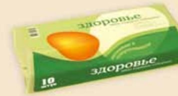
10er Superface® – E 7210