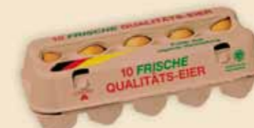
10er Fresh Pack™ – E 3810