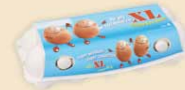
10er imagic® MAX – E 9410