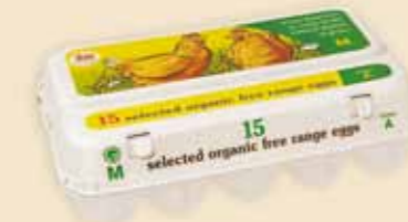
15er Plus Pack™ – E 5915