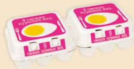
9er Plus Pack™ – E 7918