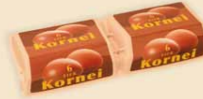
Superface® 6 æg – E7412