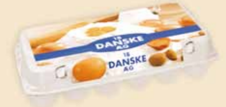
Mini Poster Pack™ 18 æg – E3918