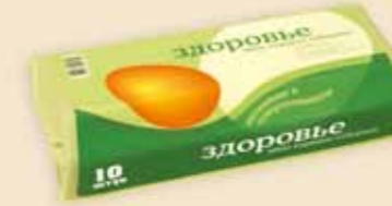
Superface® 10 æg – E7210