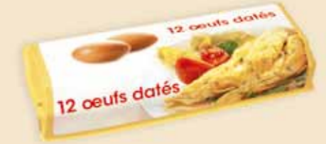
Superface® 12 æg – E7312