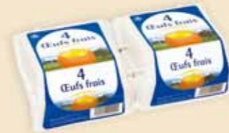
Superface® 4 æg – E7108

Vi leverer førsteklases kvalitet i 4 størrelser, 8 farver og med en høj kvalitets etiket. Dette stærkt efterspurgt produkt med ekstra plads til kommunikation, er lige så egnet til stærke brands som til æg specialiteter. Den succesfulde reklame effekt på POS er ganske forbløffende.