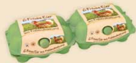
imagic® 6 æg – E9812

Til XL æg, kan vi levere den farvestrålende imagic® MAX i 2 størrelser. Bakkens markante særpræg på hylden understøttes af de eksklusive etiketter.