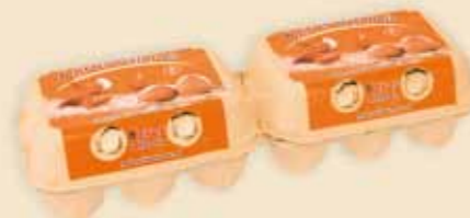
Mini Poster Pack™ 6 æg – E5312