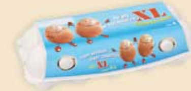
imagic® MAX 10 æg – E9410