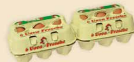
Fresh Pack™ 6 æg – E4912

Trykt i varme farver positionerer produktet sig tydeligt. Emballagen der fås i 2 forskellige størrelser, står med dets vinduer hovedsageligt for friskhed i det lavere pris segment.