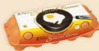
imagic® 10 æg – E9910