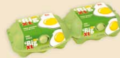
imagic® MAX 6 æg – E9312