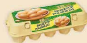
Mini Poster Pack™ 10 æg – E3310