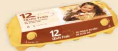
imagic® 12 æg – E9212