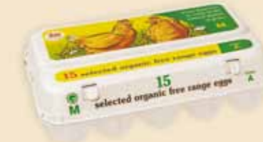
Plus Pack™ 15 æg – E5915